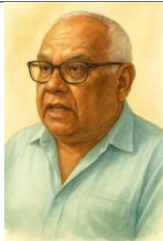
PY3SG Adair RA ANO DE 2023