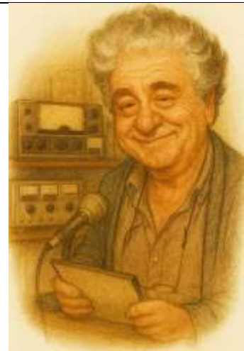
PY3KL Marcon RA ANO DE 2024

ESTAÇÃO CHAVE – Desde a última segunda-feira (20) a PY3PXY está operando como Estação Chave do Certificado 194 Anos de Emancipação de Triunfo/RS. O evento se desenvolve até o próximo sábado dia 25 de outubro de 2025 e todos aqueles que fizerem contato com a PY3PXY, incluindo os que participarem deste boletim, podem receber seu certificado de duas maneiras, uma é enviando e-mail para o endereço trunforadioclube@gmail.com com os seu indicativo data e hora do contato realizado, a outra maneira é por meio do WhatsApp, bastando você informar o seu número de WhatsApp no momento do contato para a estação chave e a partir de 5 de novembro a organização do evento estará enviando todos os certificados.