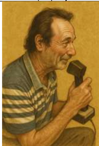
PY3MS Juracir RA ANO DE 2022